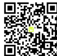
西部公民館 QRコード